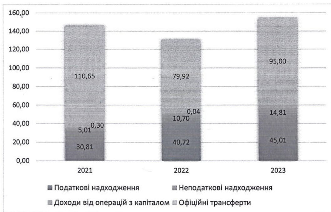
Рис. 1.9.1. Динаміка та структура доходів бюджету Вишківської селищної територіальної громади у 2021-2023 рр., млн грн

Податкові надходження. Більше половини (62,4%) усіх податкових надходжень бюджету Вишківської ТГ у 2023 році становив податок з доходів фізичних осіб (рис. 2, рис. 3). У порівнянні з 2022 роком надходження від ПДФО зросли на 3,6 %, а з 2021 роком на 48,6%. Зростання надходжень ПДФО з 2022 року зумовлено збільшенням кількості військовослужбовців у громаді та зростання розміру їх грошового утримання, а також збільшенням частки відрахування ПДФО до місцевих бюджетів на 2022-2023 роки (з 60% до 64% загальної суми цього податку).